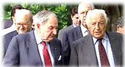
David Rockefeller e Gianni Agnelli Fiuggi 4 ott 1957

‘Siamo sull’orlo di una trasformazione globale, tutto ciò di cui abbiamo bisogno è la giusta crisi globale e le nazioni accetteranno il nuovo ordine mondiale’.