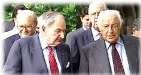
David Rockefeller e Gianni Agnelli Fiuggi 4 ott 1957

‘Siamo sull’orlo di una trasformazione globale, tutto ciò di cui abbiamo bisogno è la giusta crisi globale e le nazioni accetteranno il nuovo ordine mondiale’.